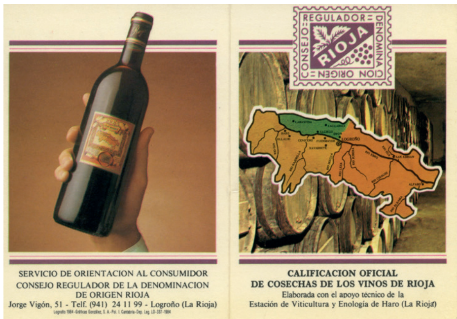
Publicaciones informativas del Consejo Regulador.