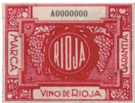
1928. Primer precinto de garantía de Rioja.

1924.- Un grupo de productores solicitó que les fuese reconocido un precinto de garantía específico que permitiese identificar los vinos de Rioja del resto.