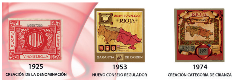
Diversos modelos de precintos antiguos del Consejo Regulador.