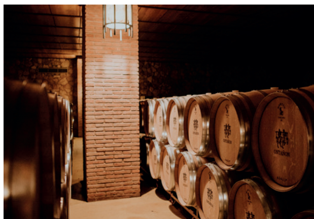
Nave de barricas de Ontañón, en El Templo del Vino.