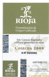
Modelos de contraetiquetas del Consejo Regulador de Rioja.