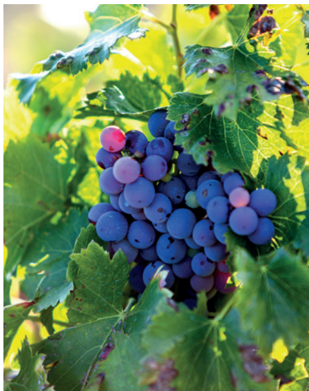
Garnachas riojanas de Ontañón Familia.

a poco la aportación de la garnacha para ahondar más en la presencia aromática y organoléptica de la fruta: “La tendencia la marca el protagonismo de la variedad y nosotros lo estamos haciendo de forma muy pausada y controlada para no perder la identidad del vino, pero haciendo hincapié en esa vocación frutal. La garnacha también nos ofrece grado y cuerpo, por eso es necesario que esa evolución sea extremadamente sutil” , recalca.