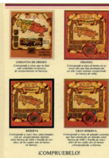
Afiche del Consejo con las añadas.

La anterior calificación es de carácter general en razón a las especiales características de las microclimas riojanos, sirviendo por tanto para cada añada las excepciones locales.