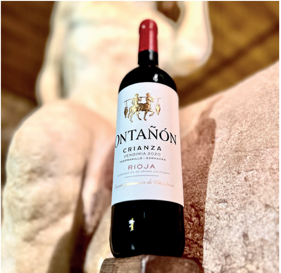
Ontañón Crianza, en el Centauro del Templo del Vino.