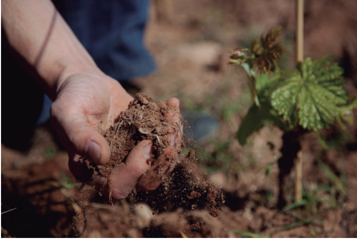
La biodiversidad de los suelos definen los viñedos de Ontañón

mucho más que sumar. Su resultado es multiplicar el protagonismo y los factores diferenciales.