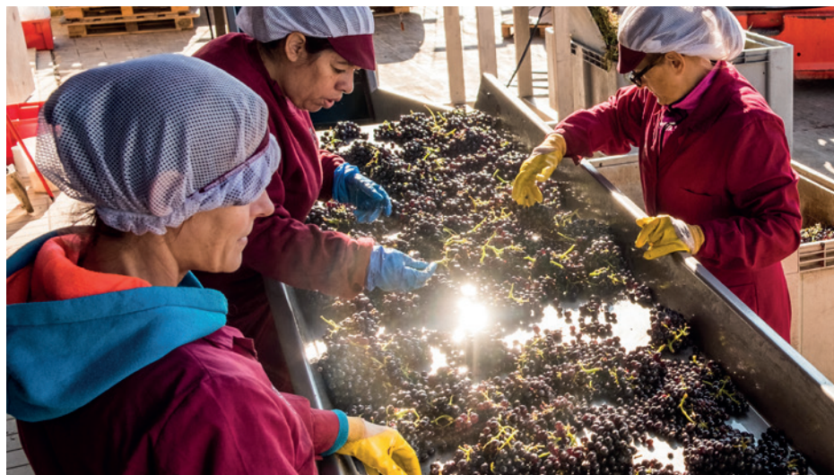
Minucioso trabajo en mesa de selección.